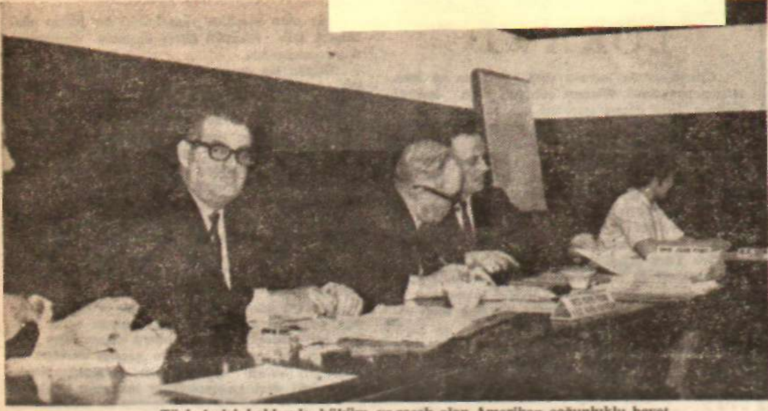
Türk işçisi hakkında hüküm ve recek olan Amerikan çoğunluklu heyet