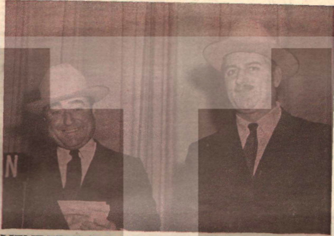
MENDERES-ZORLU : Teksaslı petrolcüler arasında